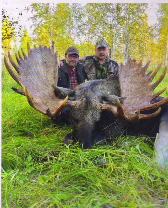
ФОТО ТРОФЕЯ КУРГАНСКОГО ЛОСЯ ИЗ ЖУРНАЛА «ОХОТА И ОХОТНИЧЬЕ ХОЗЯЙСТВО»

тября, не массово, конечно, но есть шанс добыть одного.