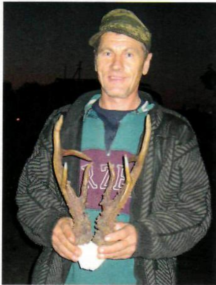
Местный охотник с трофеем из своих угодий - вызывает охотничий интерес.

Именно в тот год в Кургане был Клаус Демель, исключительный специалист по охоте на этот вид дичи.