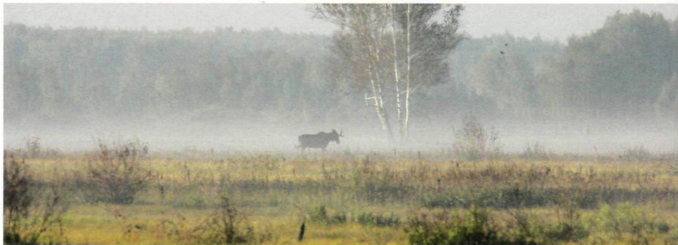
Сибирский бонус на охоте с подхода на косяку утром: молодой лось скользит на горизонте как динозавр по раннему туману